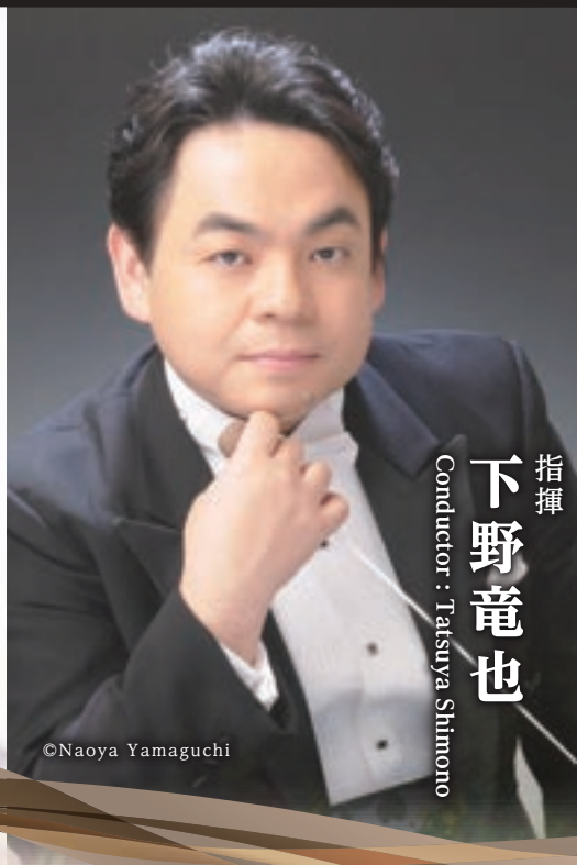
指揮 下野竜也 Conductor : Tatsuya Shimonono